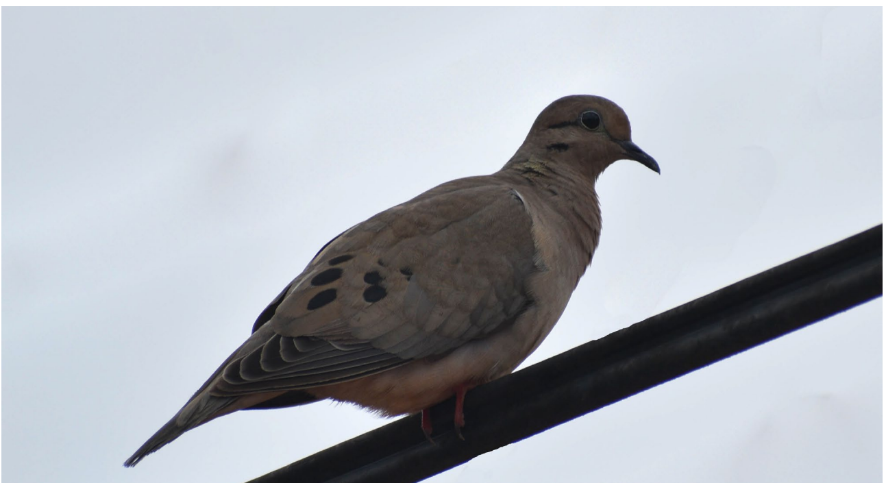
Figura 2. Individuo adulto de Tórtola Orejada ( Zenaida auriculata ) perchado en el tendido eléctrico de la ciudad de Iquitos, Loreto, Perú. Mayo 2021.